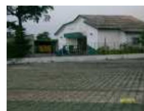
Radio Al Bayane