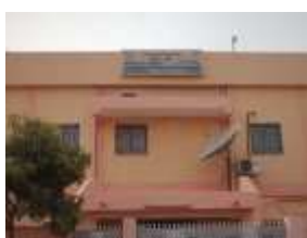
Radio Al Houada

À Ouagadougou et à Abidjan, la visibilité de l'islam à travers les radios confessionnelles est un phénomène relativement récent et a émané de la base et non de l'État [2]. Pour la radio Al Bayane , la demande déposée en 1993 ne sera acceptée qu'en 1999 et les premiers programmes diffusés en 2001 à Abidjan. La radio Al Houada commença à émettre en 2004 à Ouagadougou. Quant à la radio Ridwân , elle a été lancée en mars 2010 [3]. L'émergence de ces radios est le résultat d'un triple contexte. D'une part, c'est une réaction à la marginalisation de l'islam dans l'espace public face à aux communautés chrétiennes qui sont en position hégémonique et face aux pentecôtistes qui sont très influents sur la scène politique dans les deux pays. D'autre part, c'est l'effet du retour récent de cadres musulmans, arabisants et diplômés dans les pays arabes. Enfin, c'est aussi le résultat d'une dynamique islamique portée par de jeunes musulmans francophones.