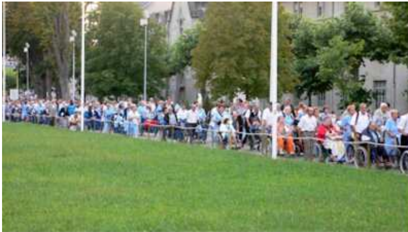
procession aux Lourdes, juillet 2007, Photographie de l'auteure flambeaux.