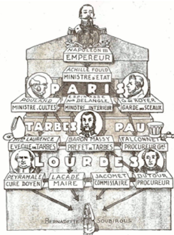
Schéma extrait de Laurentin, 1957a .