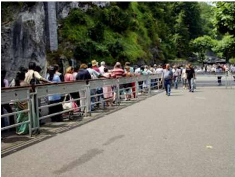
d'attente de la Lourdes, juillet 2007, file grotte.