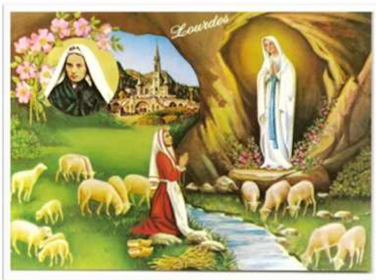
Carte postale représentant