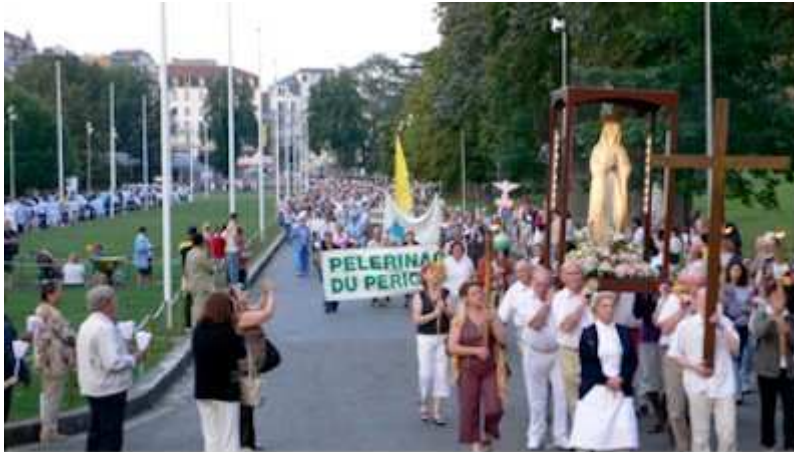
procession aux Lourdes, juillet 2007 flambeaux.